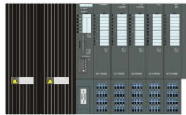
2x PS + 1x IM 152 + 32x EM