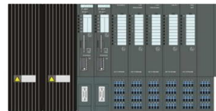
2x PS + 2x IM 152 + 32x EM

Электронные модули устанавливаются на терминальные модули TM-EM/EM. На каждый модуль TM-EM/EM устанавливается два электронных модуля. Один электронный модуль может устанавливаться на терминальный модуль TM-IM/EM.