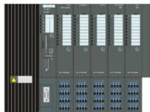
1x PS + 1x IM 152 + 32x EM