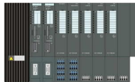
1x PS + 2x IM 152 + 32x EM